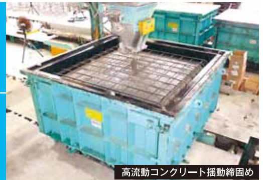
高流動コンクリート揺動締め