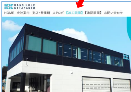
弊社ホームページ